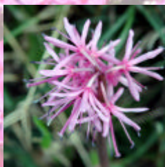
しょうじょうばかま