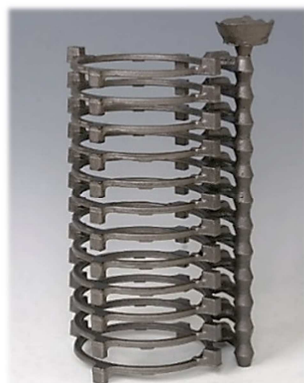
コンプレッサー部品 オルダム継手