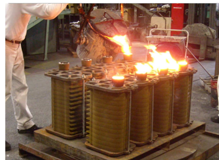
シェルスタック鋳造法

シェルモールドによって造られた鋳型を積み上げて固定し、最上部より注湯する方法をシェルスタック型法と呼びます。これはシェルモールドの寸法精度の高さを保った上で、生産性にも優れた鋳造方法です。ただし、鋳型からのガス発生量が多く ガス欠陥 、 湯回り不良 を発生しやすく薄物・小物鋳物の場合高不良率を覚悟せねばなりません。また注湯後モールドから発生する 異臭 は風下 1km 以上の範囲で臭います