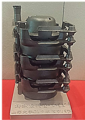
羽釜・かまどスタック