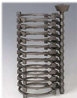
コンプレッサー部品 オルダム継手