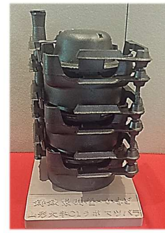
自社製品 一合吹き羽釜