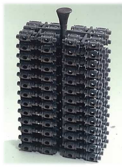
ゴム、樹脂ハンマーウエイト