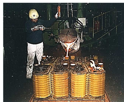
シェルスタック鋳造

シェルモールドによって造られた鋳型を積み上げて固定し、最上部より注湯する方法をシェルスタック型法と呼びます。これはシェルモールドの寸法精度の高さを保った上で、生産性にも優れた鋳造方法です。ただし、鋳型からのガス発生量が多く ガス欠陥 、 湯回り不良 を発生しやすく薄物・小物鋳物の場合高不良率を覚悟せねばなりません。また注湯後モールドから発生する 異臭 は風下 1km 以上の範囲で臭います